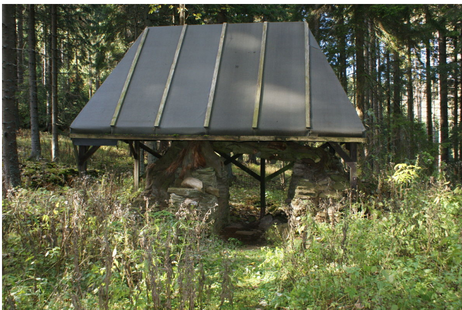
Ruins of the glassworks.