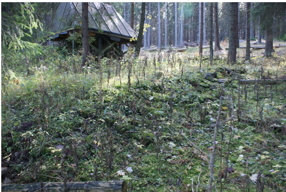
Area of the glassworks with remains of the enclosure wall.