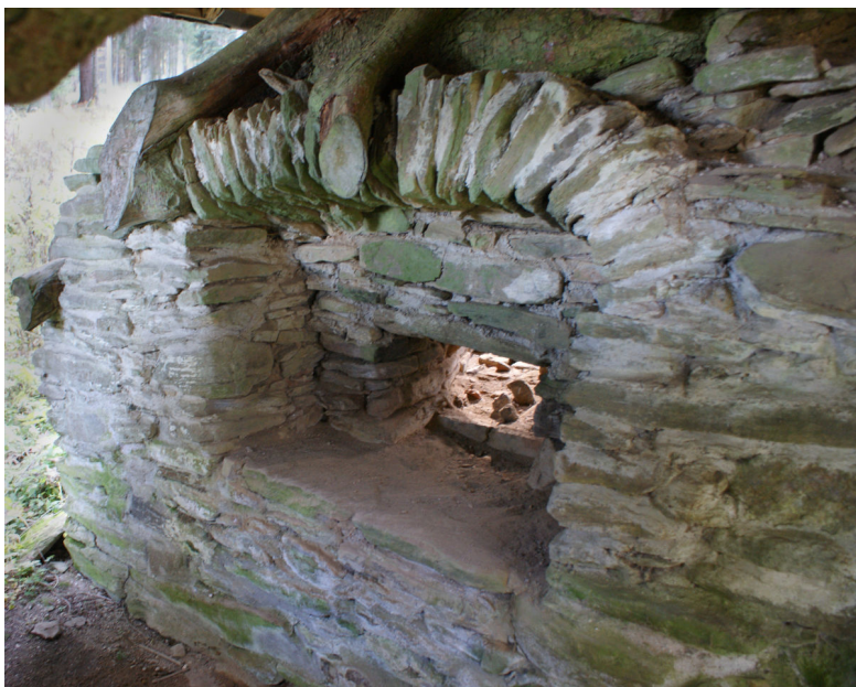
View of a niche in channel leading to the cooling area.