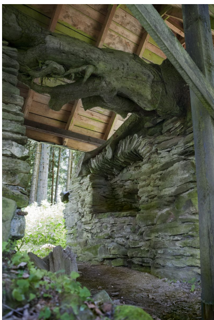
Access to the smelting furnace.